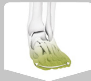
Medial lateral vipper